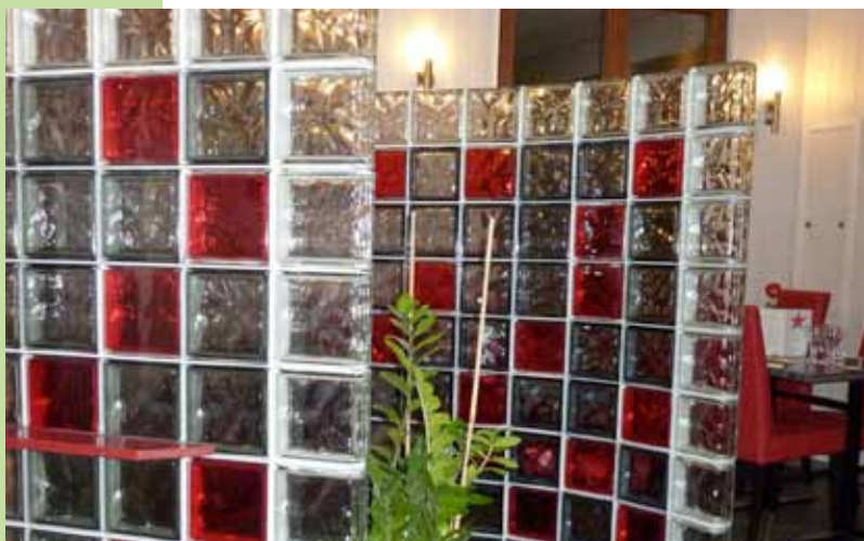
Panneaux courbes- Finition briques d'extrémité