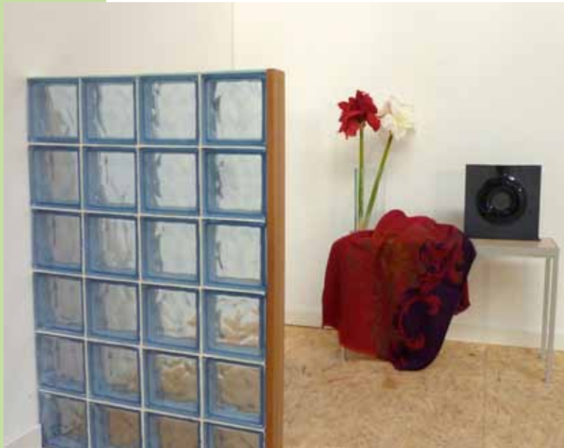
Panneau droit – Finition encadrement bois

Collage de briques de verre - Joints ultra fins 3 mm Panneaux courbes : choix de rayon