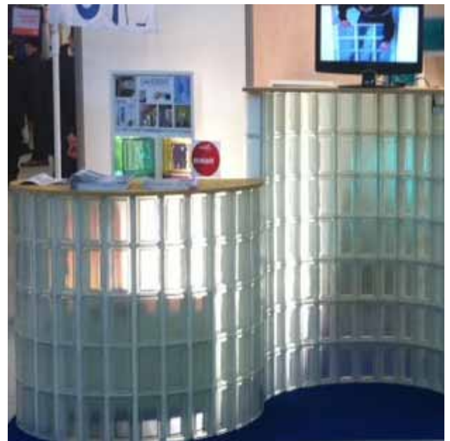
Panneau réalisé avec des briques 19x9 cm