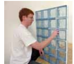
Joints silicone Saverbat